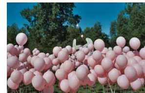
Figure Decoupée is een groot beeld dat door Pablo Picasso aan de stad werd geschonken. Op het grasveld voor het beeld werd een land-art opgebouwd door ca. 100 m 2 vogelnetten uit te spreiden. Hieraan werden 1400 met helium gevulde ballonnen vastgemaakt. Voor het beeld werd een vier meter hoog aluminium frame in de vorm van de letter K neergezet. Ook dit frame werd bekleed ballonnen in een donkerder kleurstelling. De K stond symbool voor het geschenk dat het beeld is.